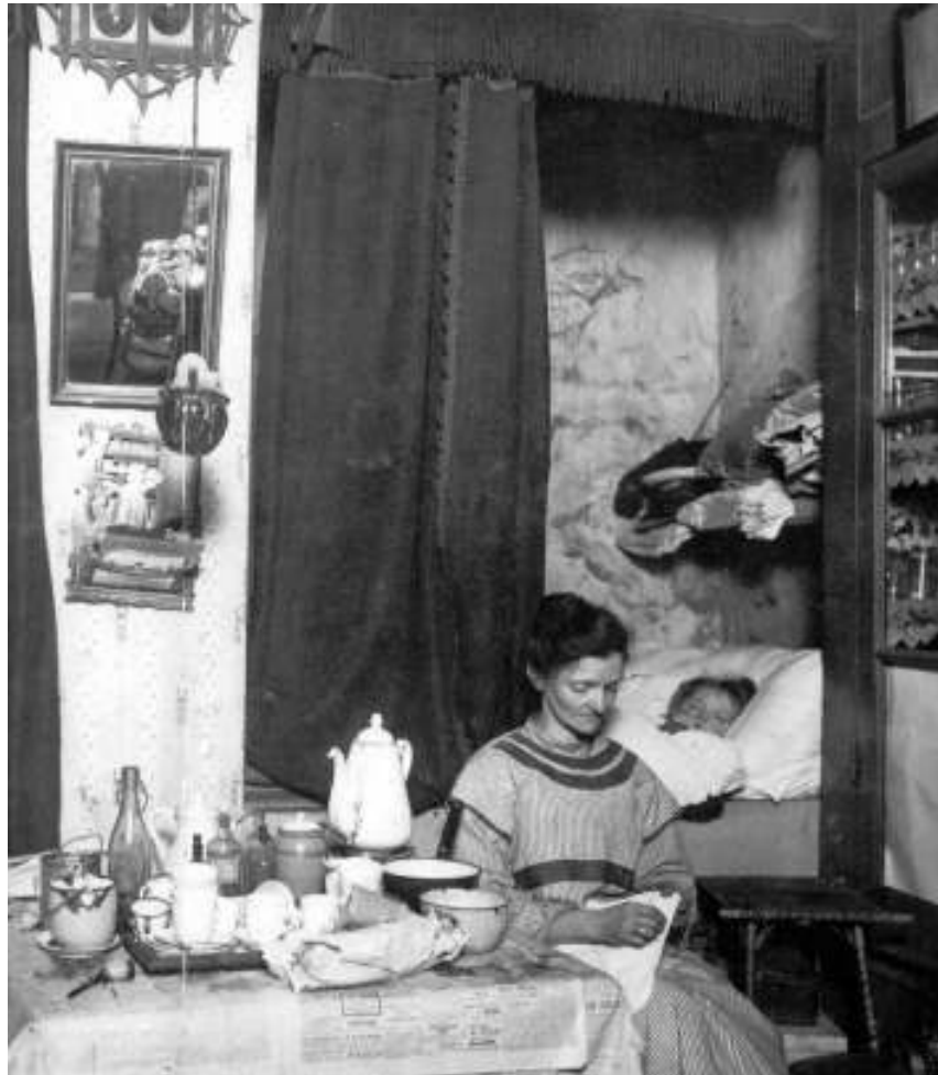
Afb. 1 De Woningwet van 1901 verbood de constructie van de traditionele bedsteden en alco- ven (Amsterdam, ca. 1900).

In plaats van bedompte bedsteden (afb. 1) stelden ze aparte slaapkamers voor met 'luchtige', open ijzeren ledikanten (Deben 1990). Ventilatie en frisse lucht waren de toverwoorden in het rapport. Onder andere in Den Haag werd naar aanleiding van het rapport een vereniging opgericht 'tot verbetering der woningen van de arbeidende klasse' die de aanbevelingen meteen in de praktijk bracht. De nieuwe huurders konden zelfs de ijzeren ledikanten bij de woningbouwvereniging huren (Deben 1990: 103-107). 5 Vermoedelijk waren dit de toen modieuze zwart gelakte spijltjesledikanten met koperen knoppen (Van Voorst tot Voorst 1979, II: 73).