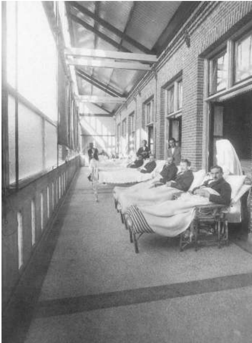
Afb. 8 Op het speciale balkon van het ziekenhuis De Mariastichting liggen tbc-patiënten te kuren in de open lucht (Haarlem, 1921).