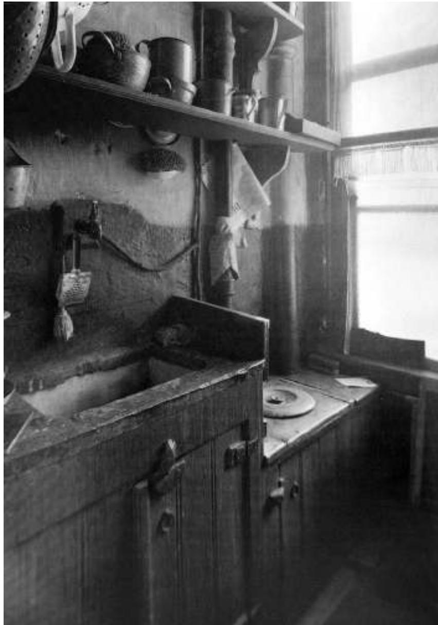
Afb. 5 Onhygiënische woontoestanden bleven tot ver in de twintigste eeuw bestaan (Amsterdamse Jordaan 1933).