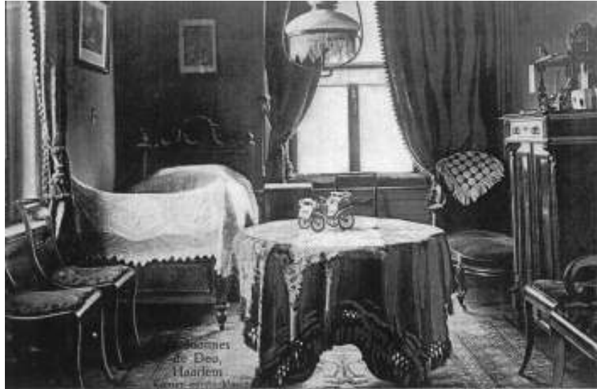
Afb. 6 De rijk gestoffeerde eersteklas kamer van het ziekenhuis Johannes de Deo (Haarlem, 1905).

Ook toen de stofzuiger in de jaren dertig een normaal huishoudelijk apparaat werd, werden slaapkamervloeren niet gezogen maar gezwabberd en nat afgenomen. Verder diende de slaapkamer en het beddengoed iedere ochtend gelucht te worden, voordat het bed weer werd opgemaakt. Eens in de week – op maandag – moesten de lakens verschoond en de dekens uit het raam en in de zon te luchten worden gehangen. De matras diende tenminste gekeerd, of op de zijkant gezet te worden om goed te ventileren. Het beste was natuurlijk als ook de matras wekelijks in de zon gelegd werd. Tot ver in de jaren zeventig gaf dit luchtende beddengoed uit de slaapkamerramen Nederlandse huizen op maandagochtend het karakteristieke, treiterige uiterlijk van gevels die massaal de tong leken uit te steken.