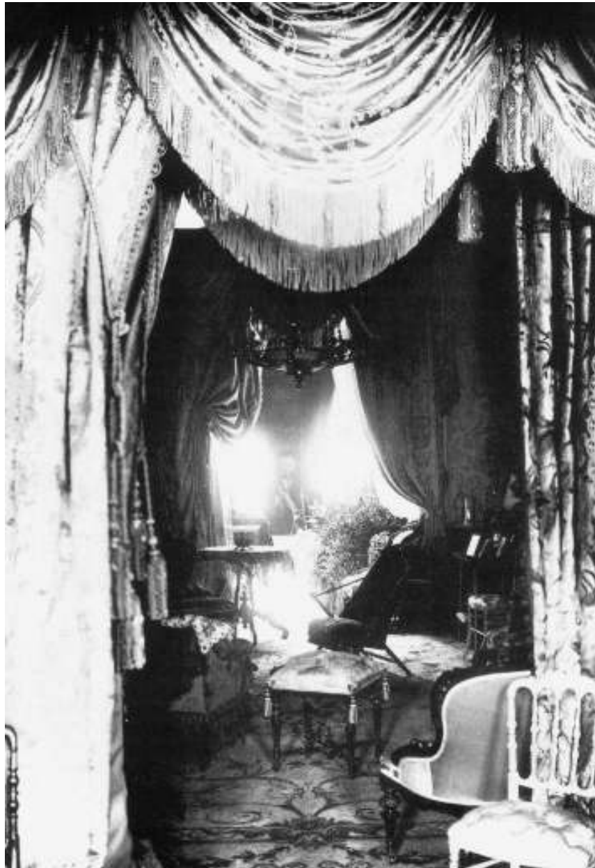
Afb. 2 Op het textiele universum van de elite had het hygiënistisch bewind aanvankelijk geen vat (Amsterdam, 1890).