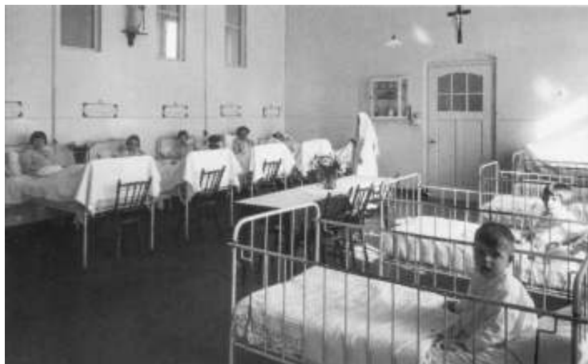
Afb. 7 Een voorbeeld van de hygiënische inrichting van derdeklas ziekenzalen, zoals de kinderzaal van het rooms-katholieke ziekenhuis De Mariastichting (Haarlem, 1937).

Er is een tijd geweest dat de eischen van hygiëne zoo hoog werden opgevoerd om niet te zeggen overdreven, dat het in de slaapkamer kil en koud was als in een ijskelder en alle comfort er uit gebannen was als uit een cel. Het opstaan en naar bed gaan gaf ongeveer hetzelfde gevoel alsof men zich in een operatie-kamer bevond. Zonder in de overdrevenheid van alles wit en gelakt ijzer en onbekleede meubelen te vervallen kan een slaapkamer aan de beste eischen van de gezondheidsleer voldoen (Wils 1923: 47).