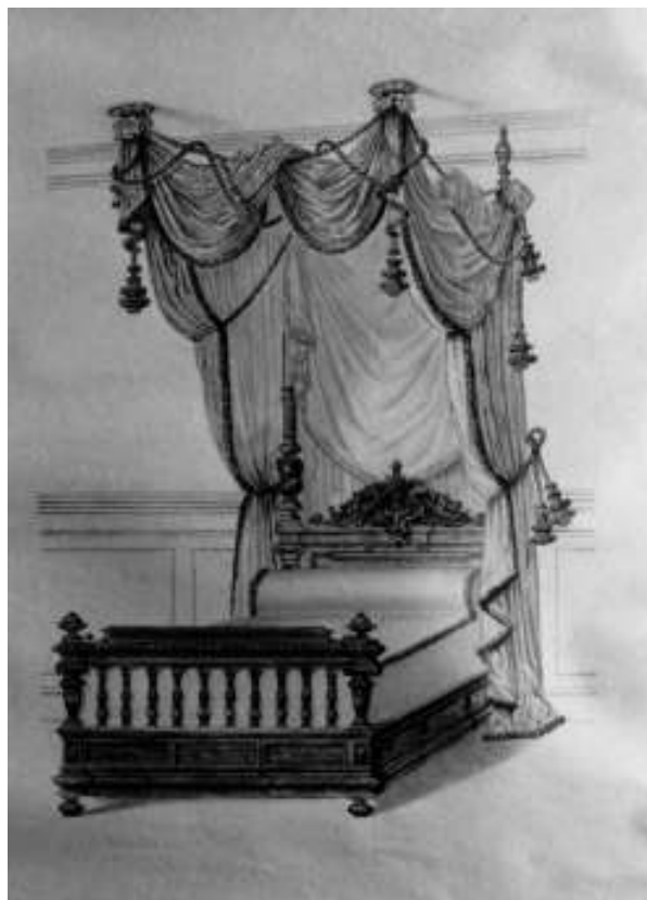
Afb. 3 De slaapkamers van de elite waren rijk gestoffeerd. Ontwerp voor een hemelbed met draperieën (1898).

kleding gebruikt worden. 6 Het gebruikte textiel moest goed wasbaar zijn en dat betekende geen rijke wollen of damasten stoffen, maar gewoon katoen en linnen. Het vermijden van hechtingsgronden voor bacteriën werd het uitgangspunt bij de materiaalkeuze voor de woninginrichting. Dergelijke drastische hygiënische maatregelen waren in de ogen van de elite alleen noodzakelijk waar het de bestrijding van de stinkende woonomstandigheden van de lagere standen betrof (Laermans & Meulders 1993: 47).