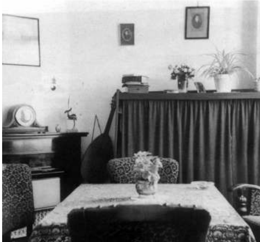
Afb. 9 Net als de vroegere bedsteden gingen ook opklapbedden weer verscholen achter mufte gordijntjes, die de slaapfunctie camouflerden. Door de woningnood waren opklapbedden na de oorlog erg populair (Amsterdam, 1959).

Het opklapbed als een vinding uit de jaren twintig zou in Nederland misschien in de vergetelheid zijn geraakt als de oorlog en de woningnood niet gevolgd waren. In de benarde woonomstandigheden waar heel veel jonge stellen belandden, werd het opklapbed ineens een populaire oplossing om de enige kamer waarover men beschikte het ordentelijke aanzicht van een woonkamer te geven. Iedere verwijzing naar het echtelijke seksleven en de nachtelijke slaapkamerfunctie werd zorgvuldig vermeden. Wel vereisten het nacht- en daggebruik iedere avond en ochtend het noodzakelijke geschuif met meubilair als het bed in- of uitgeklapt werd. Het moderne multifunctionele gebruik van vertrekken werd menig huishouden op deze manier min of meer opgedrongen. Toen de woningnood gelenigd was, verdween het opklapbed uit de woonkamer, maar in tiener- en studentenkamers bleef het tot in de jaren zestig een populaire oplossing, want zo kon ook in al die kleine slaapkamertjes een zit- of studiehoekje gecreëerd worden. 10 Tieners waren juist blij het stapelbed van hun kindertijd te kunnen verruilen voor het opklapbed.