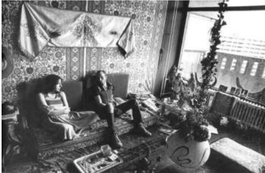
Afb. 10 Met de seksuele revolutie gaat ook het hygienistisch bewind definitief overboord. Matrassen worden op de met tapijt bedekte vloer gelegd en zowel voor zitten als voor slapen gebruikt (Amsterdam, ca. 1974).